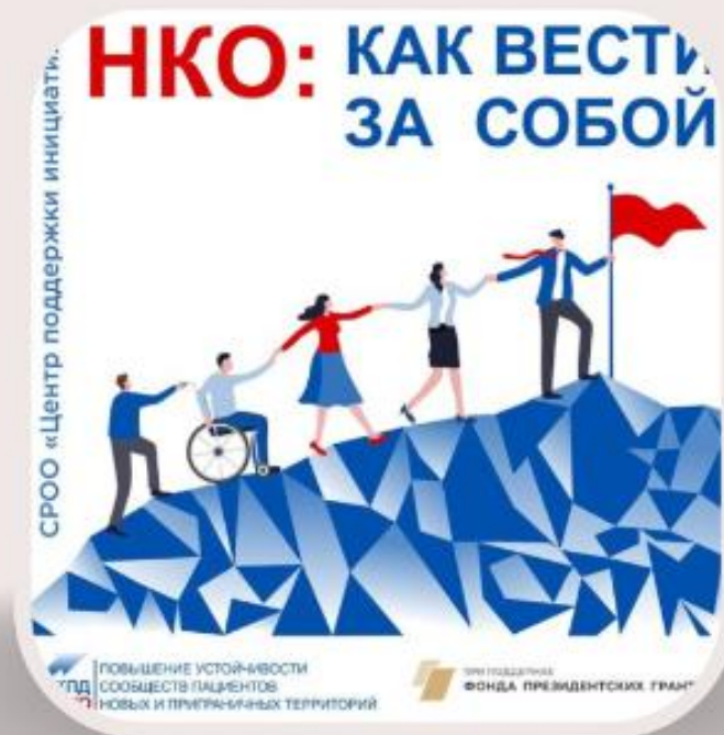
Подкаст «НКО: как вести за собой». Графика: Добро.Медиа

Подкаст для руководителей и активистов некоммерческих организаций, которые хотят научиться создавать сильные сообщества. Два раза в месяц авторы публикуют новые интервью с лидерами успешных НКО, экспертами по работе с волонтерскими организациями. В подкасте вы услышите практические советы о том, как разговаривать с разными людьми и поддерживать интерес участников. Проект реализуется Центром поддержки инициатив.