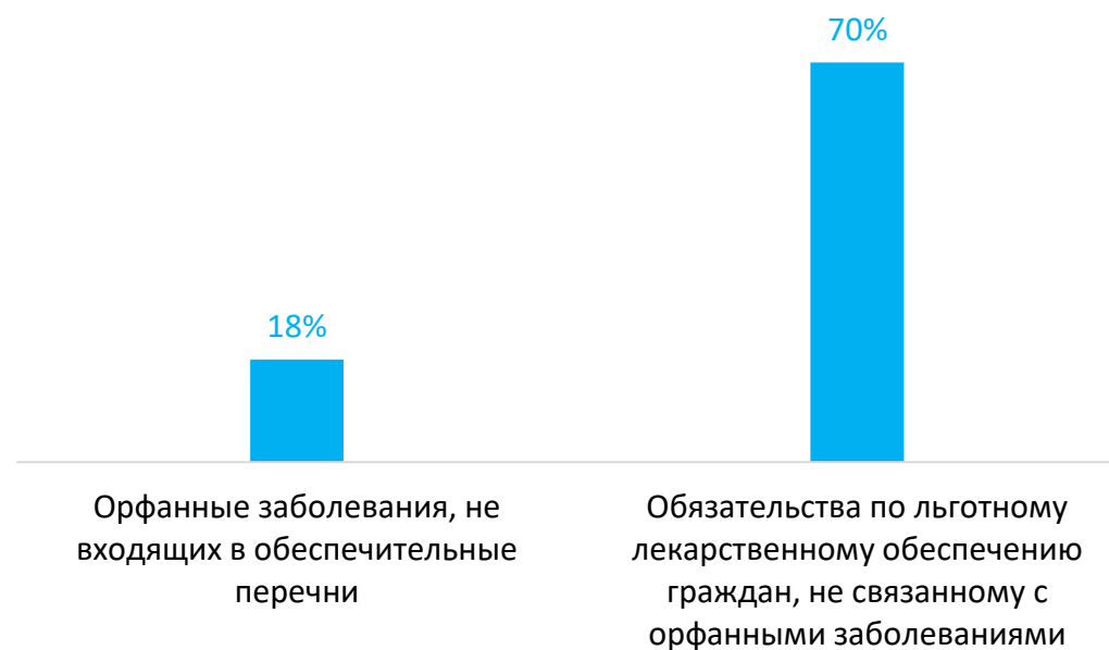
Направления расходования высвободившихся средств на уровне регионов

расходов на заболевания, предлагаемые к федерализации